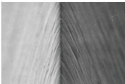
刀锋边缘的观察『扫描电镜×20,000』