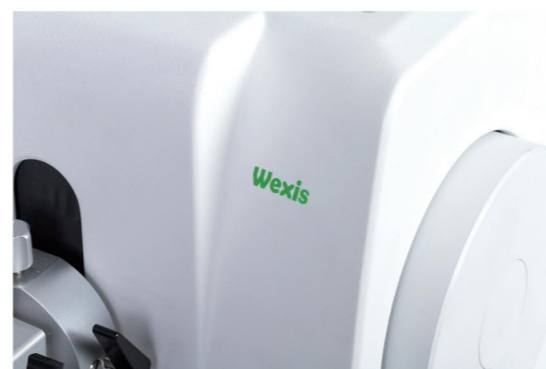
品牌：维·格斯 产地：中国·广州